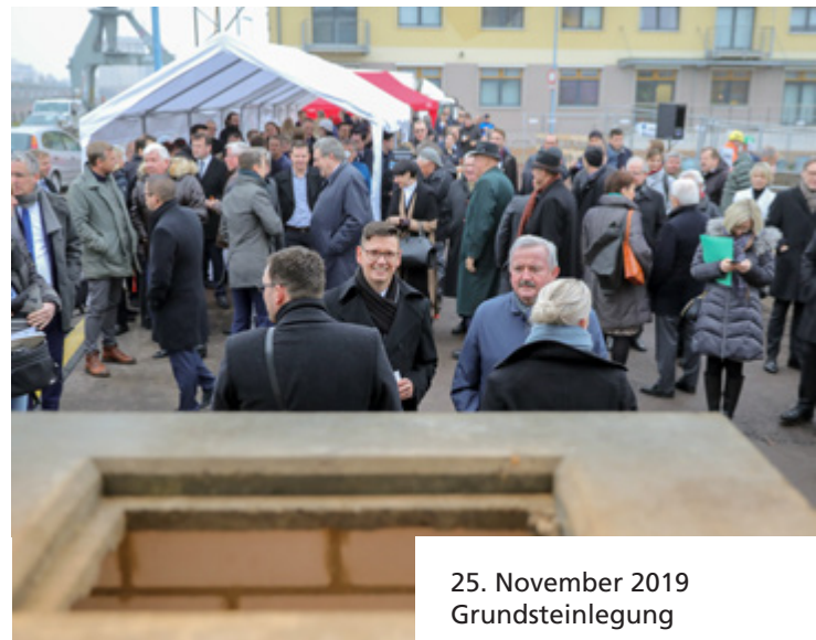
25. November 2019 Grundsteinlegung