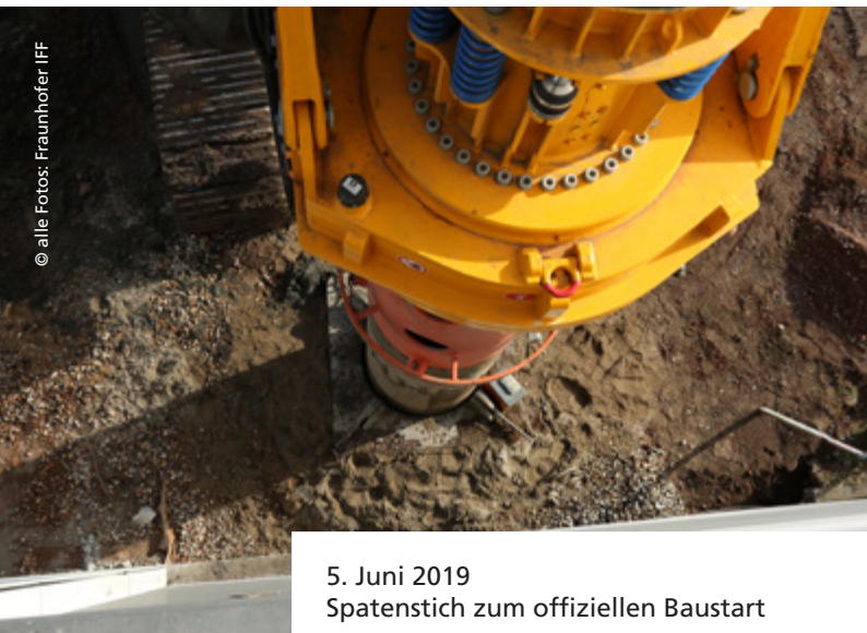
5. Juni 2019 Spatenstich zum offiziellen Baustart

In der Produktion von morgen kommt dem Menschen eine besondere Bedeutung zu. Er verfügt über wertvolle Fähigkeiten. Seine Flexibilität, Problemlösungskompetenz und Kreativität sind unübertroffen. Die