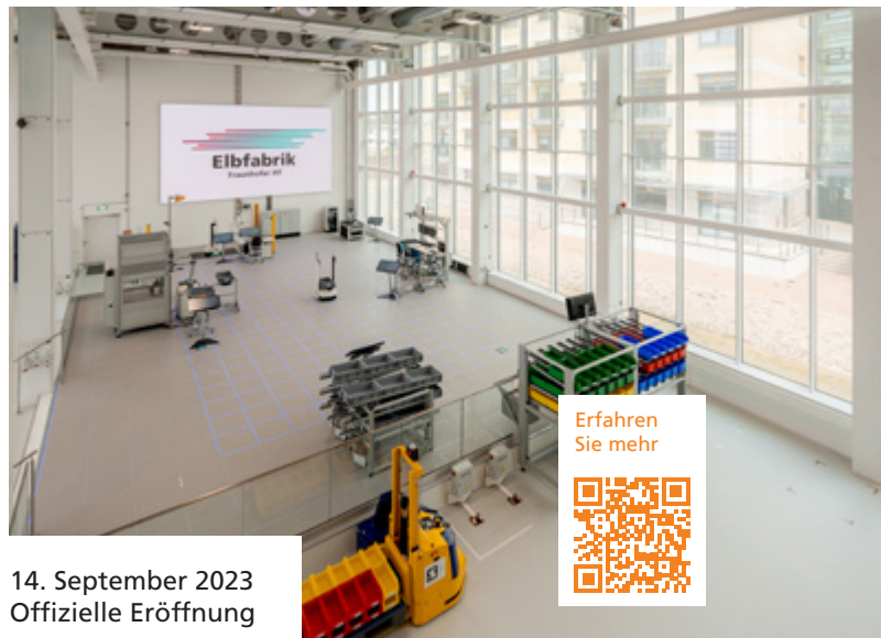
14. September 2023 Offizielle Eröffnung